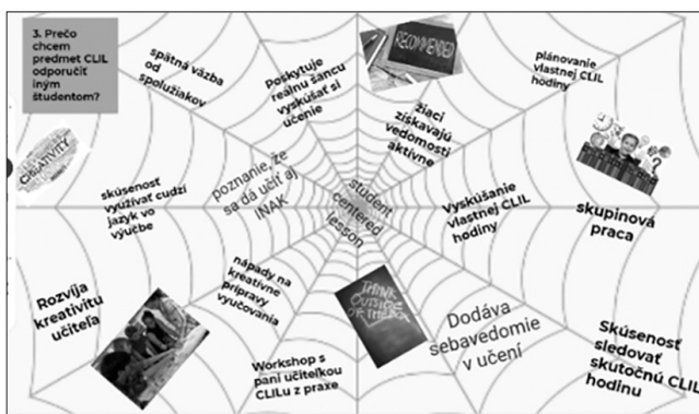
Obrázok 2 Prečo chcem predmet CLIL odporučiť iným študentom?

Na druhej strane, ak študentov ešte niečo od cudzojazyčného vyučovania prístupom CLIL odrádzalo, vo väčšine prípadov to bola časová náročnosť na prípravu a organizáciu vyučovania a rôzna jazyková úroveň žiakov, prípadne antipatia k danému cudziemu jazyku čo by následne mohlo viesť k zníženému záujmu žiakov o daný prírodovedný predmet. V prípade študentiek aprobácie prírodovedného predmetu a nemeckého jazyka bolo cítiť obavu z nemčiny, pretože si uvedomujú, že nepatrí k veľmi obľúbeným cudzím jazykom a preto sú v určitej nevýhode v porovnaní so študentami, ktorí by pri vyučovaní využili jazyk anglický. Medzi ďalšie nevýhody študenti zaradili skutočnosť, že „nie každému to môže vyhovovať“ a „introvertní žiaci môžu mať problém s prílišnými aktivitami,“ ale aj obavy „ako tú metódu predostrieť vedeniu, že takéto niečo existuje dá sa takto učiť“