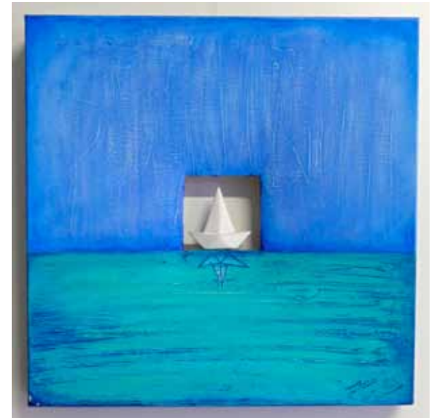
| Штефан Янцо