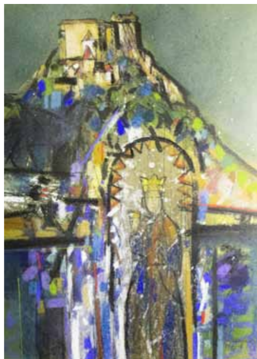
| Станіслав Харангозо