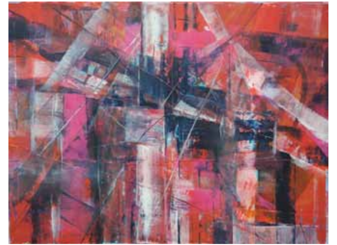
| Радка Вом