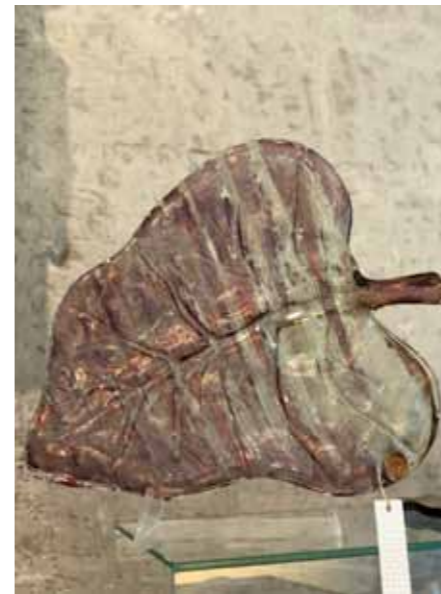
| Гордана Гласс