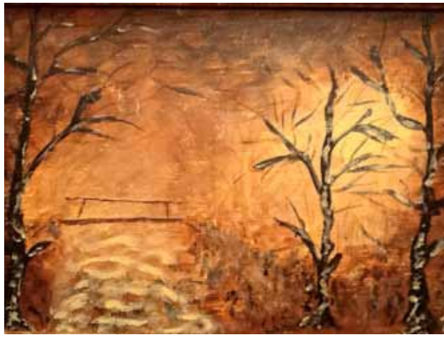
| Петер Плавчан