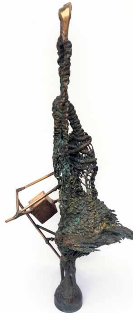
| Алоїз Драгош